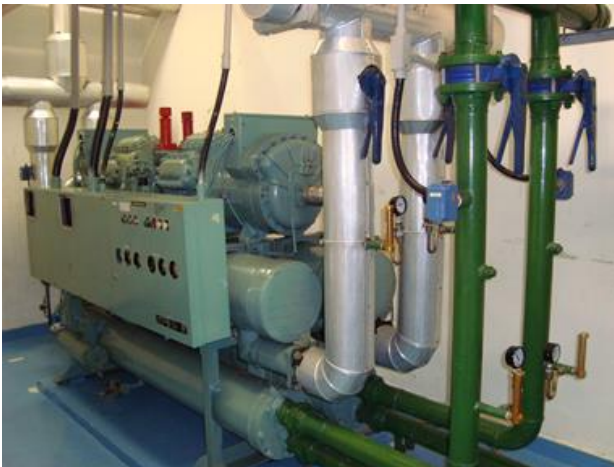
OBRA CAG AR CONDICIONADO