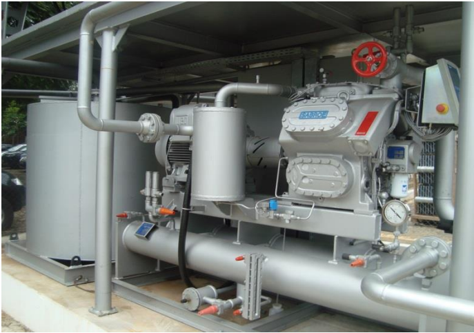
OBRA REFRIGERAÇÃO INDUSTRIAL