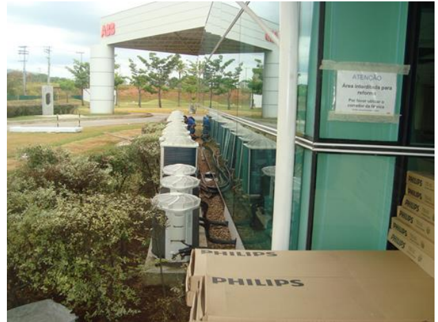
OBRA AR CONDICIONADO SPLIT

O Projeto, equipamentos e materiais serão de acordo com as normas da Associação Brasileira de Normas Técnicas - ABNT ou outras internacionalmente reconhecidas e aceitas para casos específicos.