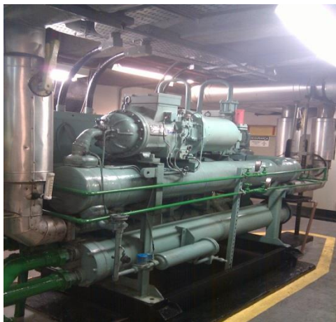
CHILLER AR CONDICIONADO