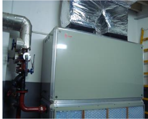
OBRA FANCOIL / DUTOS